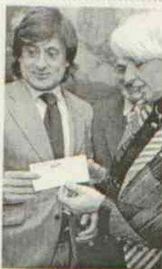
El cheque de 500 euros.

municipales acogieron con satisfacción esta iniciativa que tiene como origen la decisión de la empresa de suprimir las clásicas invitaciones y las cestas de Navidad y destinar dicho dinero a cheques para los comedores sociales de las ciudades donde la empresa tiene oficina. La alcaldesa ha señalado que es un "ejemplo a seguir".