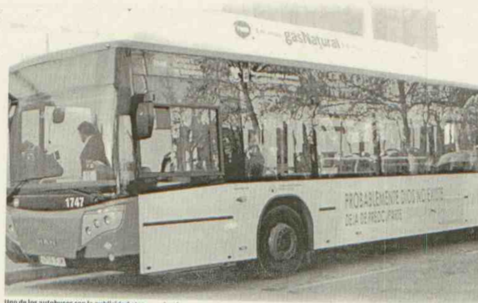
Uno de los autobuses con la publicidad atea que circulan por una de las ciudades españolas en la que está la campaña.

A pesar de todo, el vicario ha manifestado que el Obispado está tranquilo, "porque estamos seguros de que la